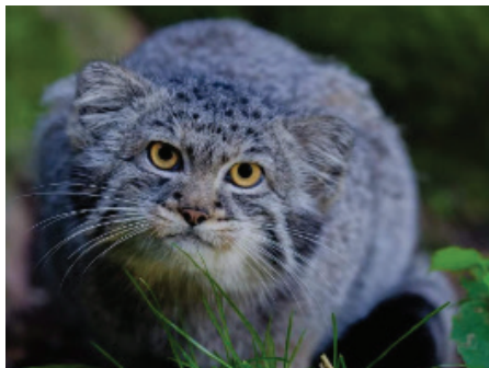
Pallaskatt ( Otocolobus manul )