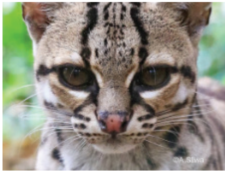
Margaykatt ( Leopardus wiedii )