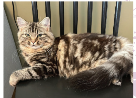
Huskatt ( Felis catus )