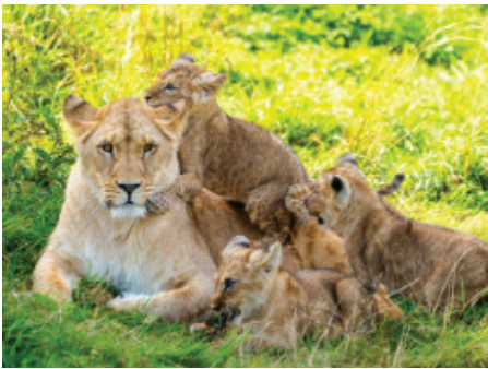
Løve ( Panthera leo )

Hva heter kattedyrene? Skriv navnet i boksen under bildet. EKSTRA: Finn artsnavnet på latin for alle kattedyrene på bildene over.