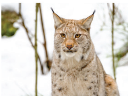
Gaupe ( Lynx lynx )