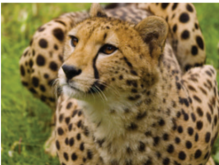
Gepard ( Acinonyx jubatus )