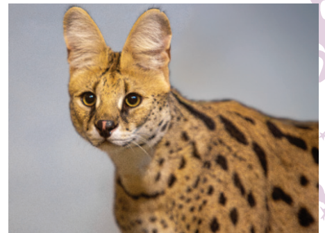
Serval ( Leptailurus serval )