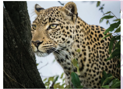
Leopard ( Panthera pardus )