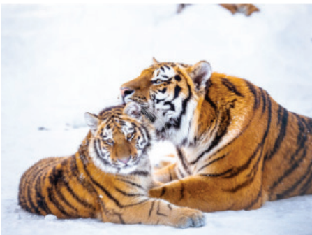
Tiger ( Panthera tigris )